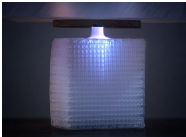
Beschichtung von Gerüststrukturen für Implantate mit einem Plasmajet.